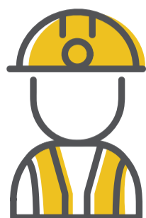
Taxa de desocupação de São Luís